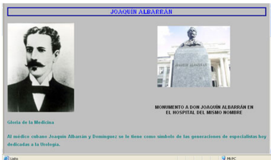
Figura 3. Fotos de Joaquín Albarrán y del hospital que lleva su nombre.

Joaquín María Albarrán Domínguez fue médico. Su obra científica en el campo de la Urología lo consagra como uno de los más importantes especialistas de esa disciplina a escala mundial. Innovó y perfeccionó la técnica instrumental, contribuyendo a preservar la salud de pacientes con afecciones renales. Fallece el 17 de enero de 1912. Fue reconocido en el ámbito mundial por su entrega a la Urología moderna. Además, realizó aportes al conocimiento médico en la Histología, Anatomía y Bacteriología Clínica. En el pasado siglo, muchos fueron los médicos cubanos que sobresalieron, por su alto nivel científico, como Juan Guiteras, Carlos Finlay, sin dudas, entre ellos, Joaquín Albarrán (figura 4).