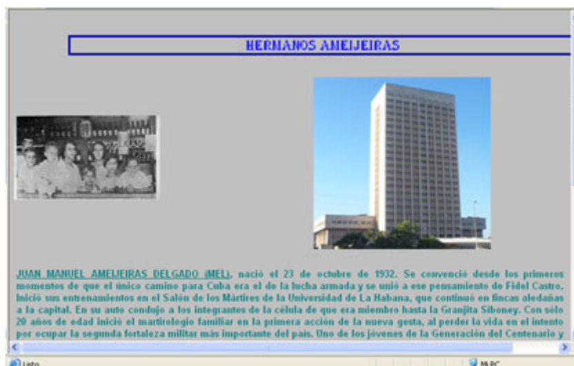
Figura 5. Fotos de los Hermanos Ameijeiras Delgado y del hospital que lleva su nombre.