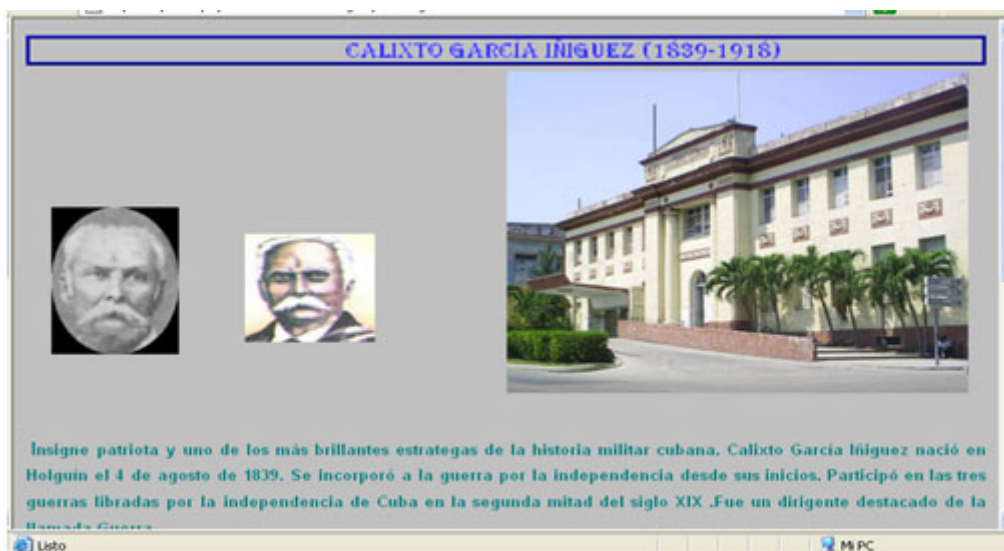
Figura 2. Fotos del prócer Calixto García y el hospital que lleva su nombre.

Calixto García Iníiguez nació en Holguín el 4 de agosto de 1839, donde adquirió los primeros conocimientos. Niño aún, fue empleado de una tienda de ropa en Bayamo y luego en Trinidad. Murió el 11 de diciembre de 1898. Cuando Carlos Manuel de Céspedes inicia la lucha por la libertad de Cuba, Calixto García se encontraba en Jiguaní y unido a Donato Mármol y a otros próceres; lucha por la libertad de Cuba y llega a alcanzar los grados de General. Cuando la deposición de Máximo Gómez como jefe del Departamento Oriental, lo sustituye. Realiza notables hechos de armas: atacó Manzanillo, Guisa, Holguín, y libró reñidos combates en Cupeyal, Zarzal, Santa María y tomó a Auras.