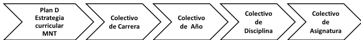
Figura 2: Estrategia curricular de MNT en los niveles de organización docente.

Las autoras estiman que los procesos de perfeccionamiento del Plan de estudio de la carrera en cuanto a la estrategia curricular de MNT, deberán considerar estas imprecisiones que atentan contra su ejecución coherente. El análisis de autores consultados (1,4,7,13) permite señalar, que los niveles de organización docente: los colectivos de carrera, año, disciplina y asignatura, tienen un papel fundamental para la adecuada implementación de las estrategias curriculares en general y, por tanto, la de MNT (Figura 2), en la medida en que constituyen los subsistemas metodológicos donde debe direccionarse su ejecución. 14