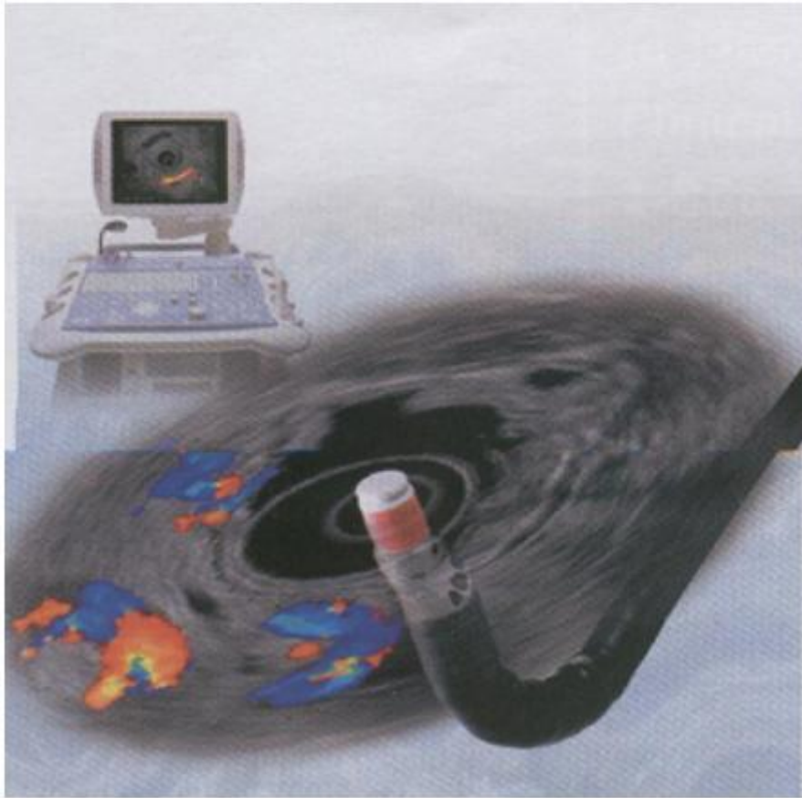
Figura 2. Equipo de Ecoendoscopia.