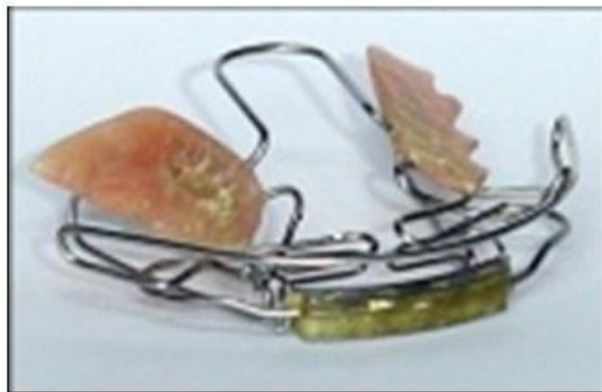
Figura 1. Modelador Elástico de Bimler Tipo A

Todos los pacientes fueron tratados con el Modelador Elástico Tipo A (Figura 1), usado para la corrección de este tipo de maloclusión. La parte superior lleva un resorte de coffin, un arco labial que esta combinado con los resortes frontales y la parte inferior consiste en dos alambres linguolabiales denominados arcos dorsales unidos a un escudo metálico. Este fue indicado de forma continua durante todo el día y la noche, excepto durante las comidas, y los resultados se analizaron a los 18 meses de tratamiento.